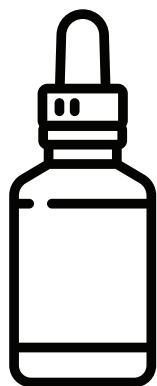
AROMA CONCENTRATO 10ML