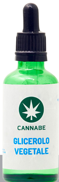
GLICEROLO VEGETALE FU

Combinando queste 3 tipologie di componenti puoi ottenere diversi gusti di Liquidi con CBD: