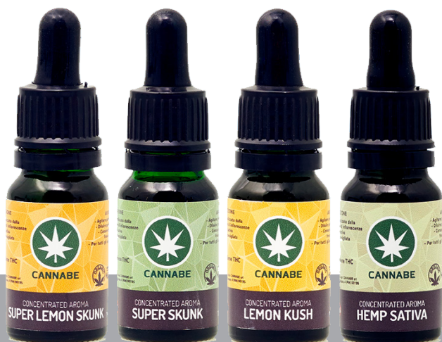
AROMI CONCENTRATI DA 10ML