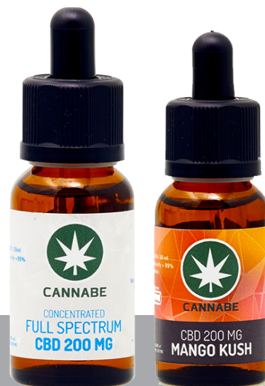
CONCENTRATI CBD 20ML