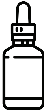
FULL SPECTRUM CBD IN GLICOLE PROPILENICO 20ML